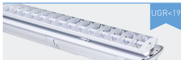
FUTURA NB 2.4ft (s mřížkou)